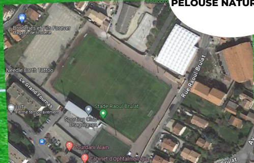
STADE RAOUL BRULAT PELOUSE NATURELLE